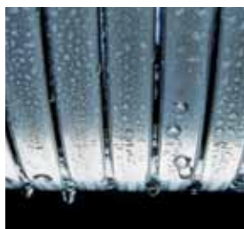
Surface d'échange Inox-Radial

Les chaudières gaz à condensation Vitodens 200-W et 222-W offrent des solutions efficaces et rentables pour les petits et les grands besoins de chaleur.